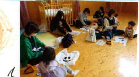
親子でカボチャのお面とマカス、おぼけの衣装を製作しました。