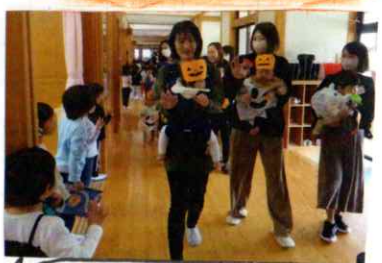
仮装をして、みんなで園内巡り。お兄さん、お姉さんが「かわいい」と手を振ってくれました。

10月のこりくらぶ 10月20日(金) 遊戯室でハロウィンパーティーをしました。