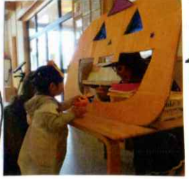
カボチャおぼけと魔法の魔女さんに「トリック・オア・トリート」と言い、おやつをもらいました。